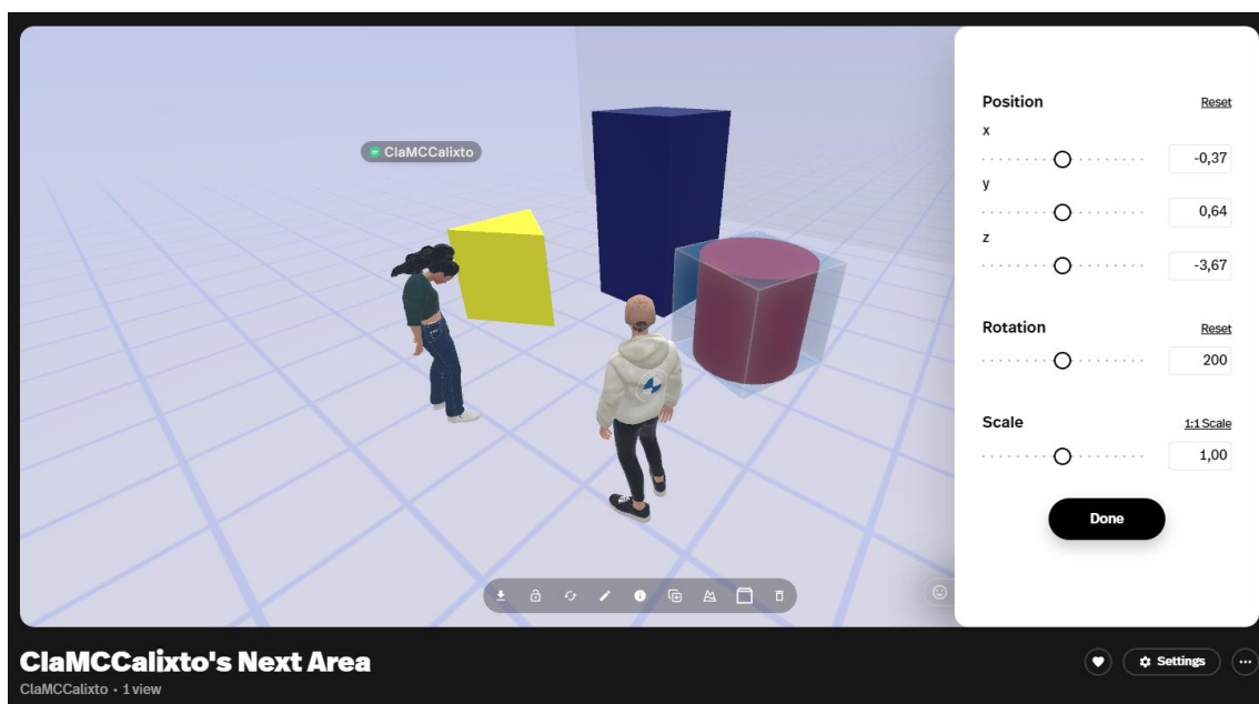
Figura 3 - Experimento realizado na plataforma Spatial. Fonte: dos autores.

A Figura 2 representa uma primeira versão do ambiente criado no Spatial com a participação de duas pessoas representadas pelos seus avatares. No momento deste teste, as duas pessoas no ambiente se encontravam em localizações geográficas distintas e interagem em tempo real dentro do ambiente. Na mesma figura, também está sendo mostrado o painel lateral que permite a manipulação dos objetos previamente modelados no Sketchup. Nesse caso o cilindro vermelho que é mostrado selecionado.