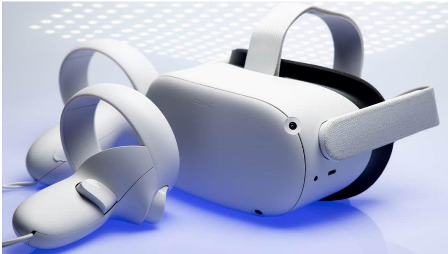
Figura 2 – Equipamento Meta Quest 2.

Encontra-se em tramitação o documento de aprovação pelo comitê de ética em pesquisa local, que respaldará a segunda parte da pesquisa, onde serão realizados experimentos em sala de aula com a utilização do equipamento de imersão no metaverso e com a utilização do ambiente desenvolvido apenas na tela do computador. Os protocolos a serem adotados na utilização do equipamento em sala de aula fazem parte do planejamento na segunda etapa da pesquisa. Tal equipamento é denominado Meta Quest 2 (Figura 2).